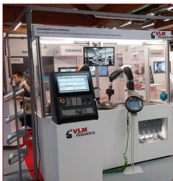
cellule bi-robots en direct control de manufacturing et CND in process