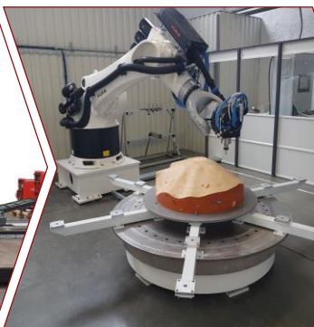
cellule d'usinage multifonction composite (Nimitech, Lauak)